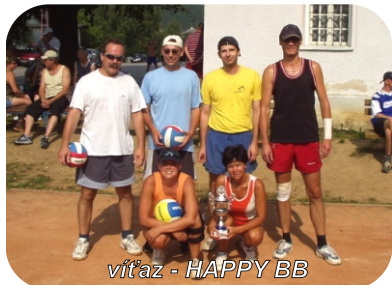
víťaz - HAPPY BB