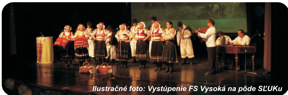
Ilustračné foto: Vystúpenie FS Vysoká na pôde SĽUKU