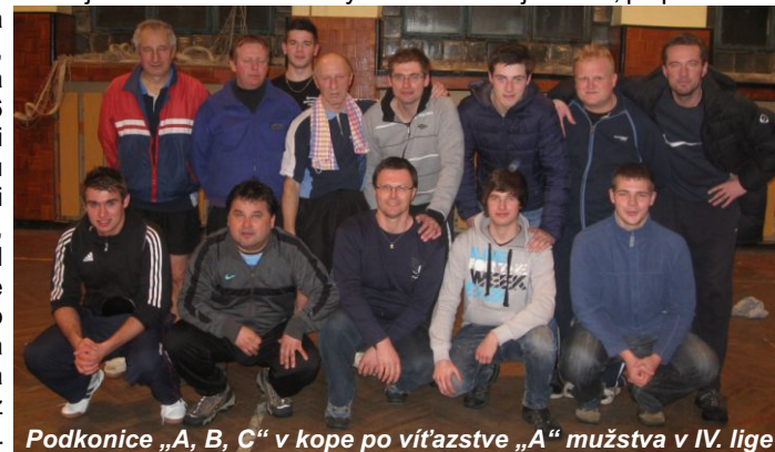
Podkonice „A, B, C“ v kope po víťazstve „A“ mužstva v IV. lige

Toto všetko sa dialo v podkonickej telocvični v utorok 19. februára 2013 vo večerných hodinách. V zápase stolnotenisovej IV. ligy sa totiž rozhodovalo o víťazovi súťaže a teda aj o tíme, ktorý postúpi do baráže o postup do III. ligy. Domáce áčko proti áčku Riečky. Dva dovtedy nezdolané mančafy v priamom súboji kto z koho. Po úvodných štvorhrách je to 1:1, po prvom kole dvojhier 3:3. Potom prichádza prvý trhák domácich na 5:3, ale následne po dlhých a vyrovnaných zápasoch je 5:6 pre hostí. Odvtedy ale domáci zabrali, naplno využili výhodu domáceho prostredia, a hoci sú zápasy naozaj tesné, hostia si už žiadny bod nepripísali a Podkonice zaslúžene vyhrávajú tento dôležitý duel v pomere 12:6, a tím sa stali víťazom IV. ligy a obhájili tak prvé miesto z vlaňajška.