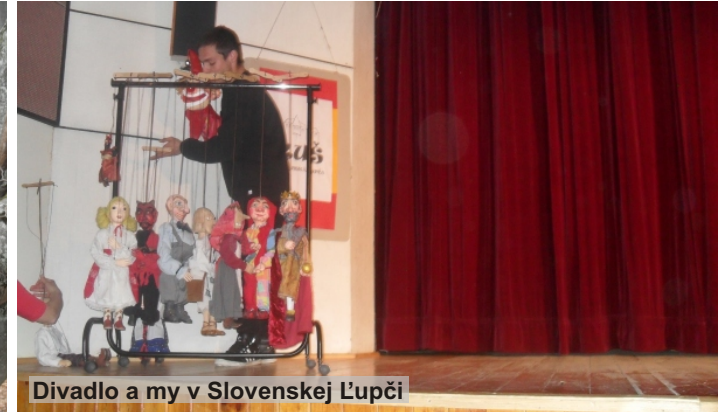
Divadlo a my v Slovenskej Ľupči