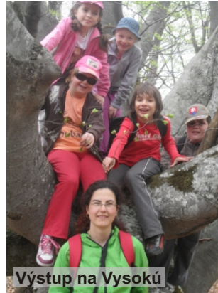
Výstup na Vysokú