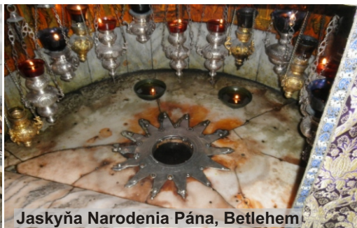
Jaskyňa Narodenia Pána, Betlehem