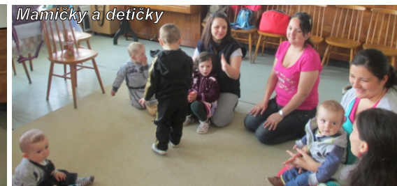
Mamičky a detičky