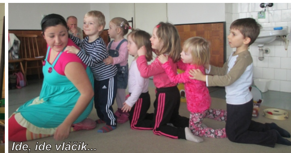
Ide, ide vláčik...

Piesne o zvieratkách, príbehy o nezbednej myške, hadovi Aurelovi, žabej rodinke, dohovárnanie Daždici Upršanej, brazílsky prales, pieseň o blchách, vyrábanie hudobných nástrojov z pet fliaš a iného odpadového materiálu, cvičenie pre dobrú kondičku a všeličo iné.....takto v skratke vyzerali zatiaľ naše muzikolandačné stretnutia, ktoré sú každý utorok o 10:00 hodine s Malkáčmi a každý štvrtok o 17:00 hodine s Veľkáčmi.