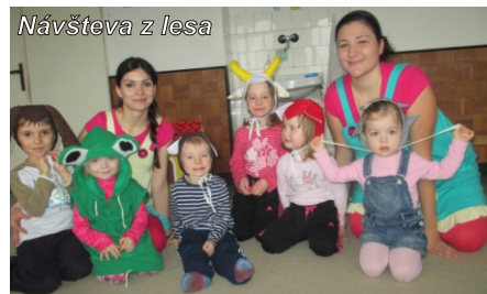
Návšteva z lesa