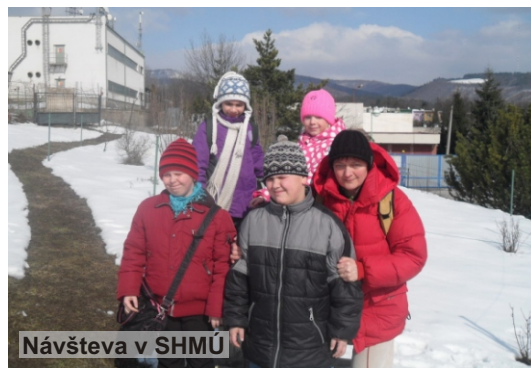
Návšteva v SHMÚ