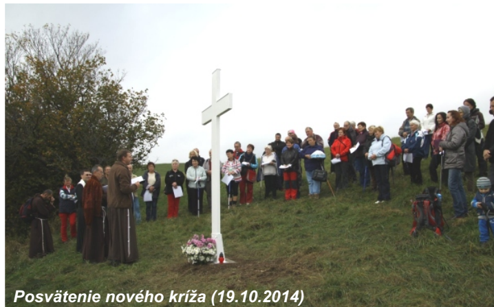
Posvätenie nového kríža (19.10.2014)