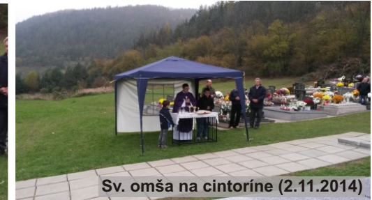
Sv. omša na cintoríne (2.11.2014)

Prejdeme popri hroboch, najmä na staršom cintoríne, kde už nežijú potomkovia. Pozriem na meno, ak tam vôbec nejaké je. Z mnohých hrobov je už len kôпка zeme a nebudaj zvalený drevený kríž. Na jednom hrobe pri chodníku ma zaujal nápis: „Smrťou život nekončí, ale smrťou niekoho sa život mení.“ Odišli ste do nenávratna a my už len modlitbou zmierňujeme svoj žiaľ. Tá modlitba vrúcne zabliká v podobe vďačnej chryzantémy. Určitá nostalgia zostáva v nás cestou domov, slzy dojatia, úprimný pohľad na priestor cintorína. A ešte povedzme posledné v tento deň: „Odpočívajte všetci v pokoji!“