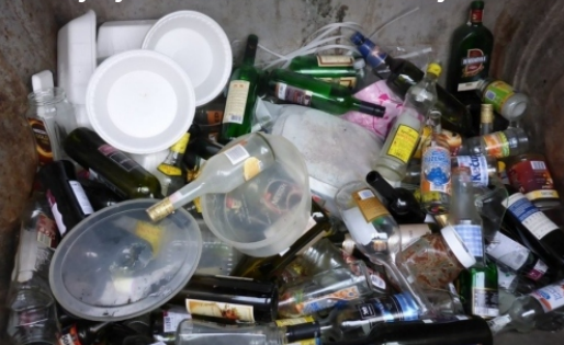
Plasty vyhodené v nádobe určenej na sklo