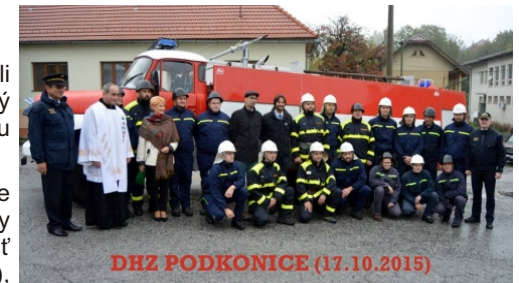
DHZ PODKONICE (17.10.2015)