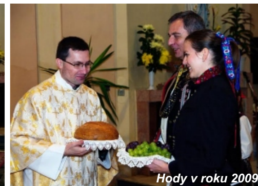
Hody v roku 2009