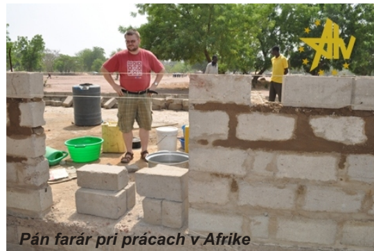
Pán farár pri prácach v Afrike