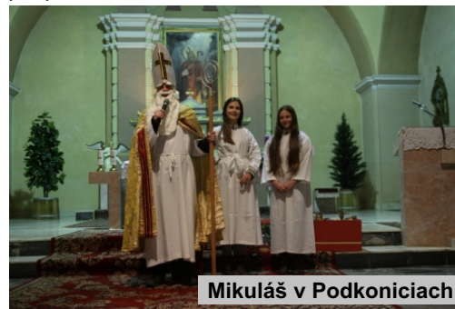
Mikuláš v Podkoniciach