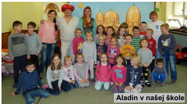
Aladin v našej škole

V tomto mesiaci 19. 11. nás navštívilo aj profesionálne divadlo s názvom „Divadlo bez opony“ a rozprávkou Aladin nás zaviedli do ďalekého orientu. Úžasné herecké výkony, dialógy pretkávané rýmami a vtipnými momentami dostali nielen deti, ale aj nás dospelých. Zasmiali sme sa do sýtosti a dohodli sme sa, že určite u nás neboli prvý a posledný krát. Naozaj úžasný umelecký zážitok.